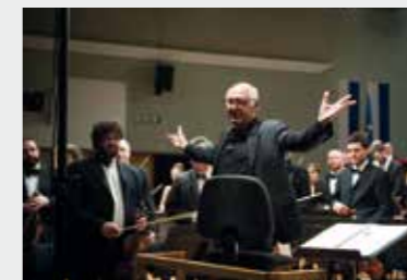
21 Μαρτίου 2014 Ο Michael Nyman με την ΚΟΘ