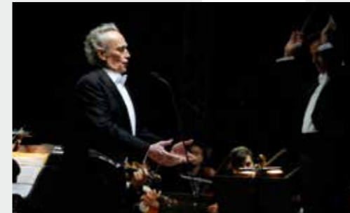
7 Σεπτεμβρίου 2009 Ο Jose Carreras με την ΚΟΘ