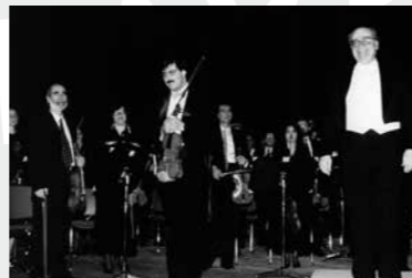
Λεωνίδας Καβάκος - Κοσμάς Γαλιλαίας