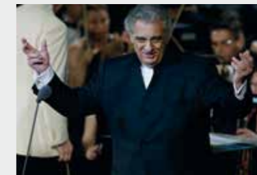
15 Ιουνίου 2005 Ο Plácido Domingo με την ΚΟΘ στο Ηρώδειο