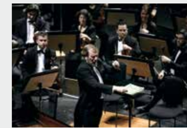
8 Δεκεμβρίου 2006_Ο Maxim Shostakovich διευθύνει την ΚΟΘ σε έργα του πατέρα του