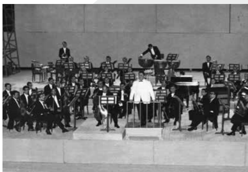
Ο Μάνος Χατζιδάκις διευθύνει μουσικούς των ελληνικών ορχηστρών στο Ηρώδειο