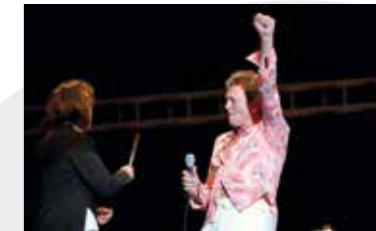
30 Ιουνίου 2007 Συμφωνικό ροκ με τον Ian Gillan