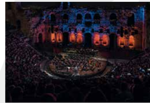
8 Σεπτεμβρίου 2018 80 χρόνια Μάνος Λοιζος στο Ηρώδειο