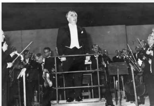
Ο Αράμ Χατσατουριάν με την ΚΟΘ